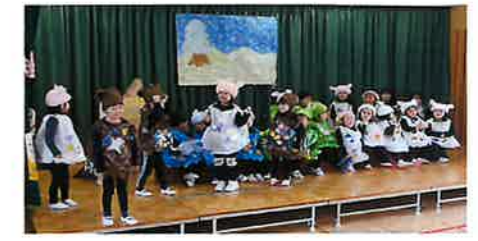
うさぎ組 表現遊び「てぶくろ」