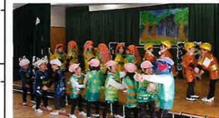
ばんだ組 劇「めっきらもつきらどおんどん」