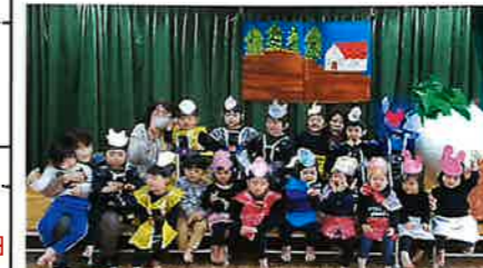
りす組 表現遊び「おおきなかぶ」