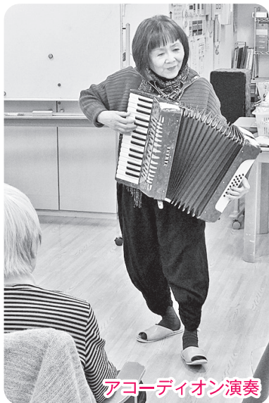
アコーディオン演奏