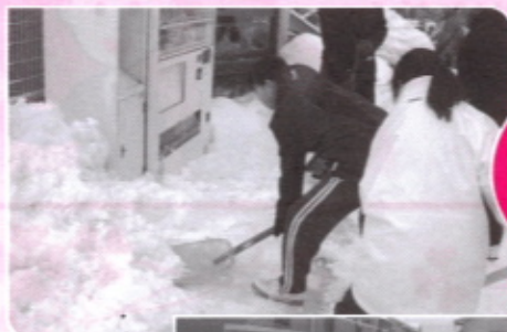
東金井駅 美化活動 ボランティア