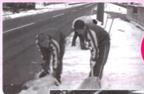
東海大学 山形高校生 ボランティア

山形市社会福祉協議会では相談支援や連絡調整などを行い、学校と地域が連携してすすめる福祉活動を支援していきます。